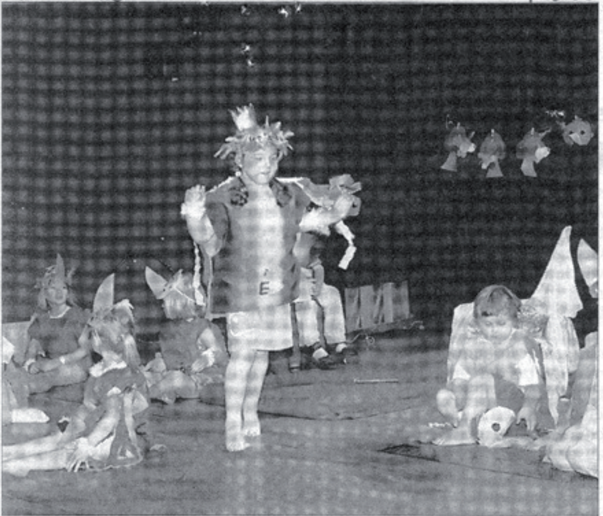
Elf Kinder brachten in der Barockfabrik einen musikalischen Bestseller auf die Bühne: Rolf Zuckowskis „Vogelhochzeit“.